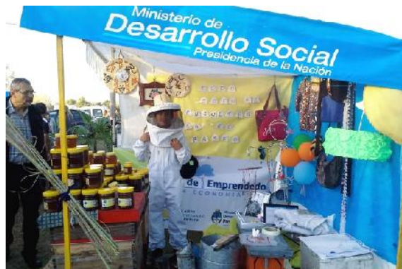
Figura 2: Exposición ferial de San Vicente, con apoyo nacional.