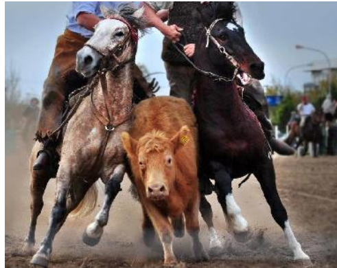
Figura 4, 5 y 6: Destrezas criollas