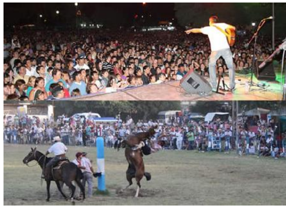
Figura 1, 2 y 3: Desfile de carrozas, tropillas y destrezas criollas

Las fiestas pueden agruparse de acuerdo a su época de realización: la mayor concentración se da en los meses de noviembre, diciembre, febrero, mayo y septiembre (aproximadamente un 60%), mientras que el porcentaje es mucho menor en los meses de junio, julio y agosto. Estas celebraciones se desarrollan en varios días del calendario e incluyen una variada cantidad de acciones que suelen finalizar en una noche o velada central. Al mismo tiempo, se realizan rituales como la entrega de ofrendas y la muestra de imágenes religiosas, los desfiles de carrozas con representaciones iconográficas alusivas, maquinarias antiguas y modernas, tropillas y promoción de comidas típicas.