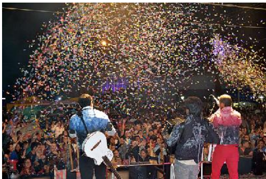
Figura 7,8 y 9: Espectáculos folclóricos, ballet de danzas y elección de reinas

En la mayoría de estas fiestas las expresiones artísticas, fundamentalmente la música y la danza tradicional, ocupan un lugar relevante en las distintas jornadas a través de la actuación en el escenario principal de artistas nacionales reconocidos y grupos locales, para culminar, en la mayoría de los casos con la elección de la reina y la entrega de premios correspondientes a los concursos realizados en el marco de las mismas.